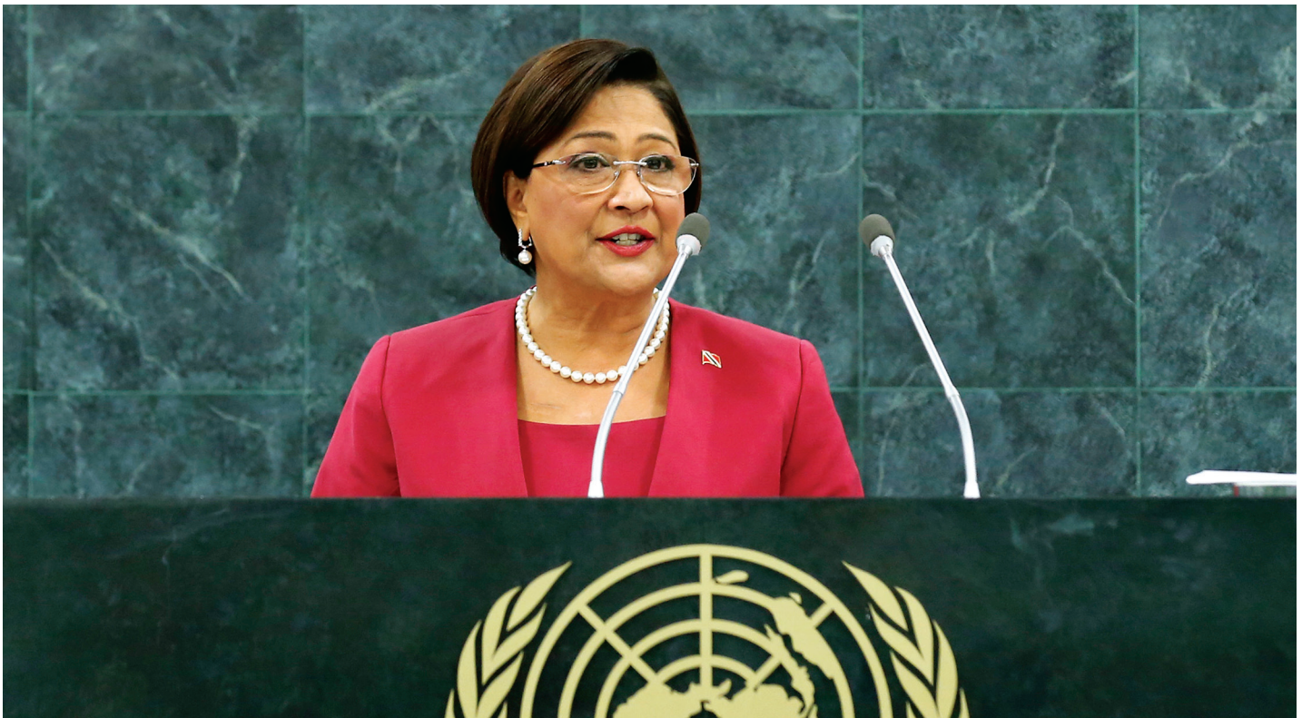
Kamla Persad-Bissessar, Primera Ministra de Trinidad y Tobago, se dirige el debate general de la sesión 68 de la Asamblea General de las Naciones Unidas.