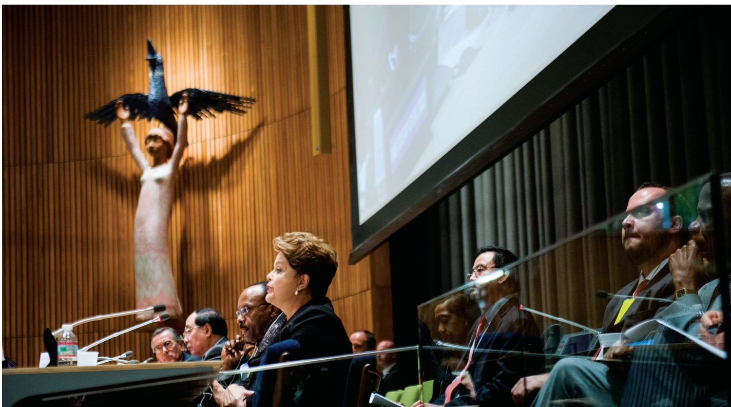
Dilma Rousseff, Presidenta de Brasil, interviene durante la reunión inaugural del Foro de Política de Alto Nivel sobre Desarrollo Sostenible.