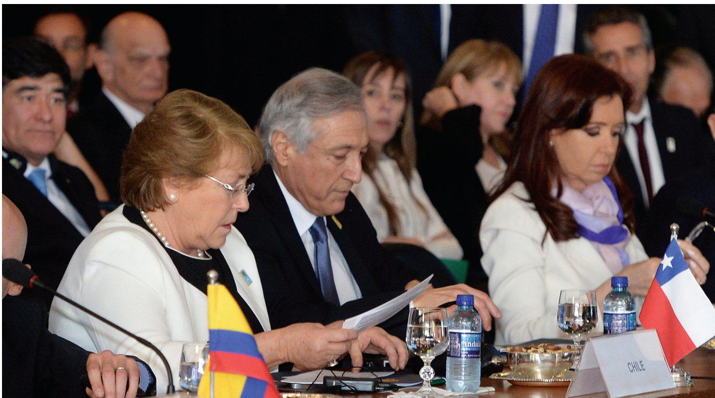
Las presidentas de Chile, Michelle Bachelet, y de Argentina, Cristina Fernández, participan de la Cumbre BRICS UNASUR en Brasilia.