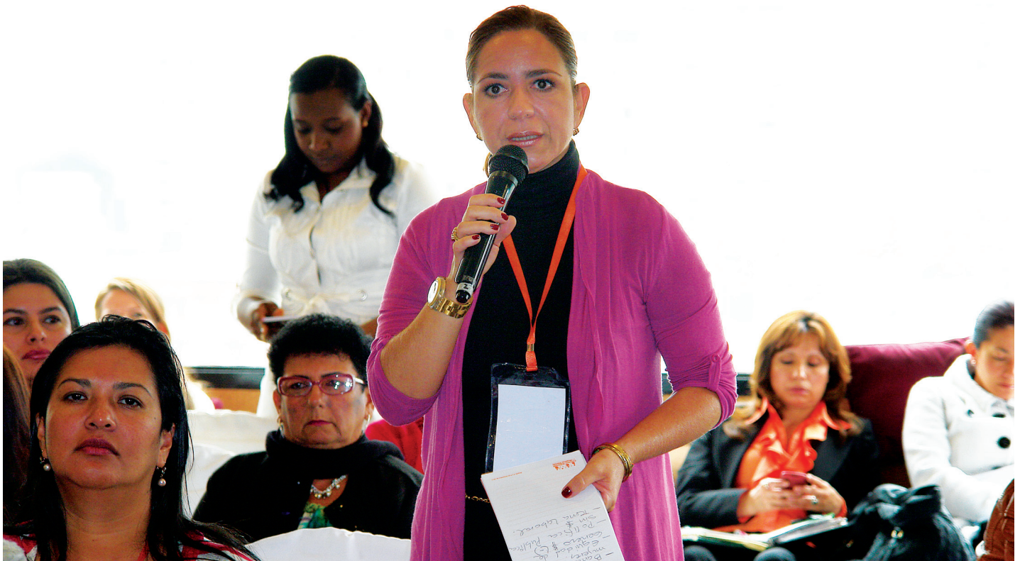
Cumbre Nacional de Mujeres Electas en Colombia organizado por el Ministerio del Interior, PNUD, ONU Mujeres, la Mesa de Género de la Cooperación Internacional, NDI e Idea Internacional.