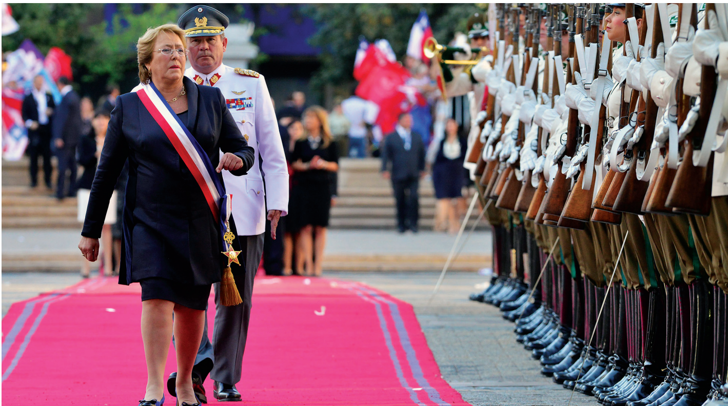
La Presidenta de Chile, Michelle Bachelet, llega al Palacio de la Moneda.