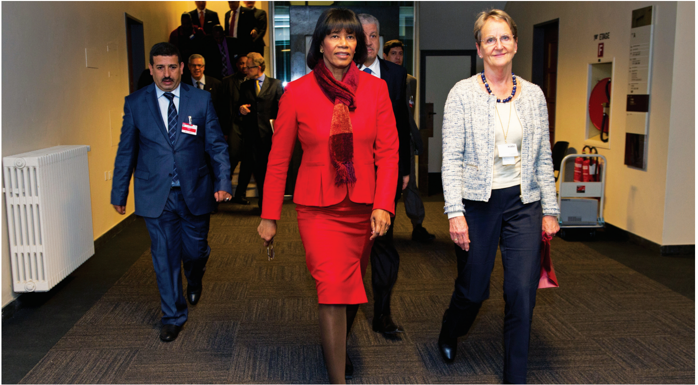
Portia Simpson Miller, Primera Ministra de Jamaica, a su llegada en Ginebra para el 50 Aniversario de UNITAR.