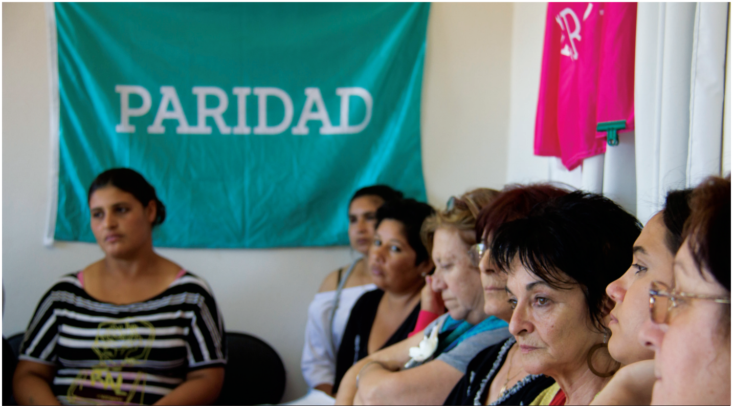
Encuentro de mujeres por la paridad en Uruguay.