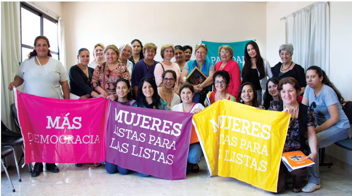
Encuentro de mujeres por la paridad en Uruguay.