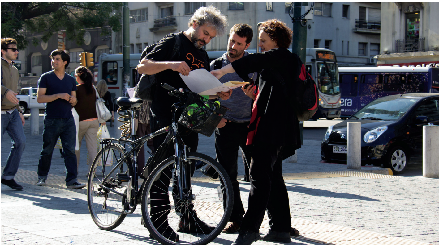
Recolección de firmas “por la paridad” en Uruguay, impulsado Cotidiano Mujer, CIRE y CNS Mujeres, con el apoyo de ONU Mujeres.